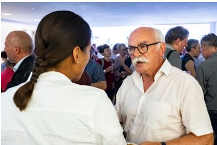
Am GI-Apéro mit Hugo Fasel, Direktor der Caritas Schweiz